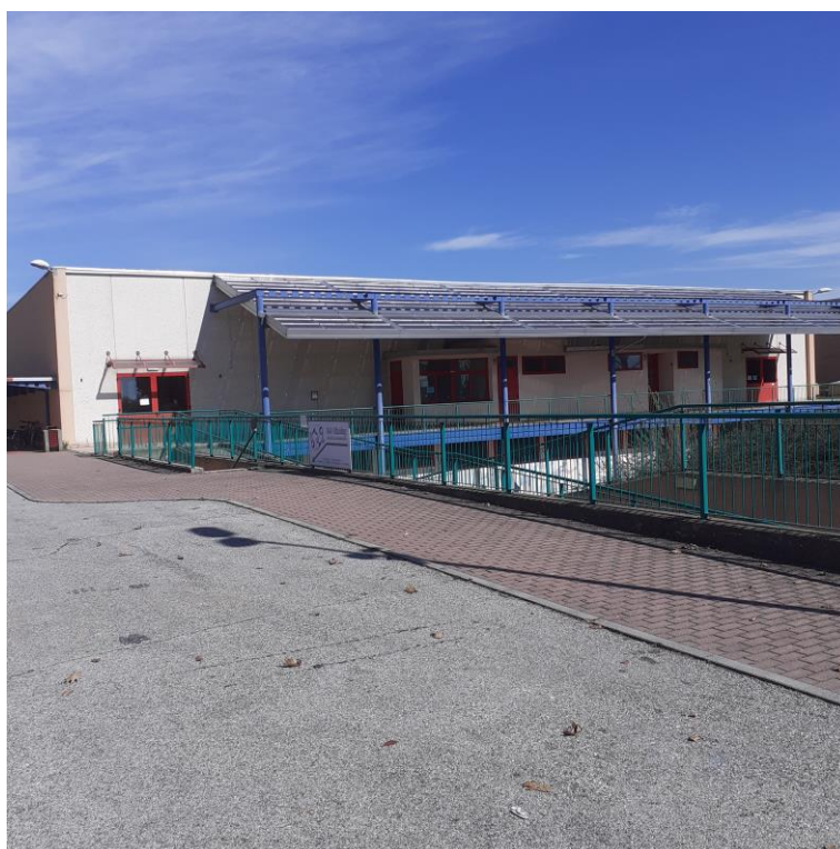
Vista dal parcheggio del prospetto Sud